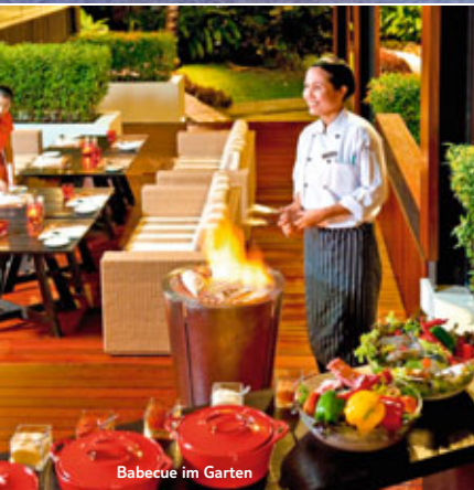
Babecue im Garten